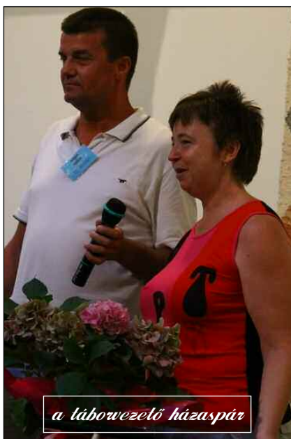
a táborvezető házaspár

A kellsi csapat szerdán városnézéssel töltötte az estét, amelynek csúcspontja a dunai hajóút volt. A város a felújított és kivilágított Parlament épületével, a hidakkal és a Várnegyed fényeivel teljes dicsőségében uralja a Duna-partot, amit mindannyian tátott szájjal néztek. Természetesen semmiképpen nem feledkezhetünk meg az