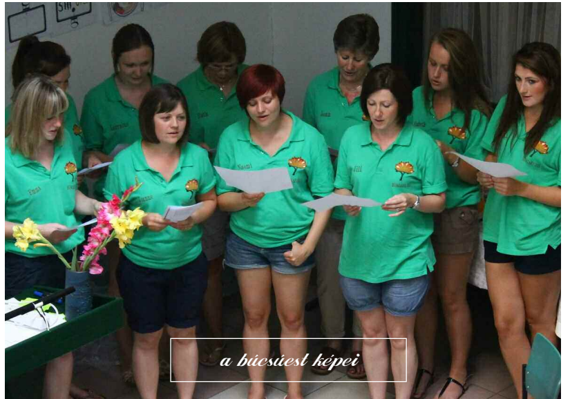
a búcsúest képei