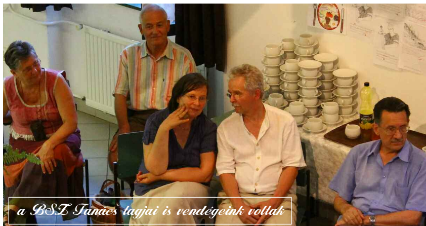
a BSI Tanács tagjai is vendégeink voltak

„Szeretném megköszönni a tábor, a szervezést, a programot és mindent... A lányok nagyon boldogan jöttek haza... és azóta is folyamatosan mesélnék... a kamasz lányom el volt ragadtatva... és ez nála nagy szó!” – egy édesanya