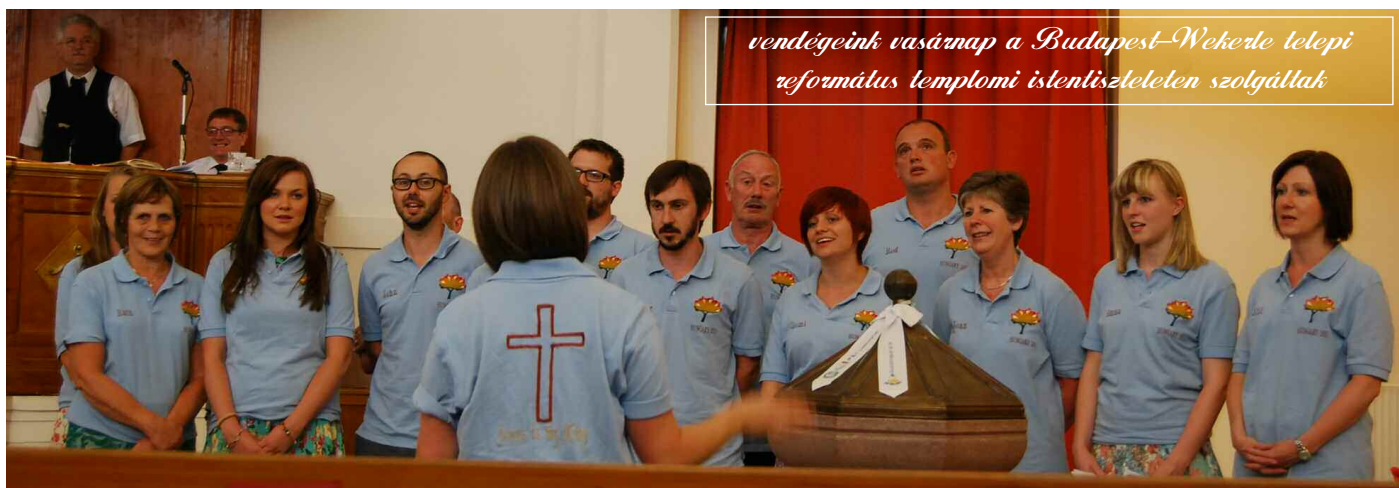
vendégeink vasárnap a Budapest-Wekerle telepi református lemplomi isteniszületelen szolgáltak

„Szeretném megköszönni a tábor, a szervezést, a programot és mindent... A lányok nagyon boldogan jöttek haza... és azóta is folyamatosan mesélnék... a kamasz lányom el volt ragadtatva... és ez nála nagy szó!” – egy édesanya