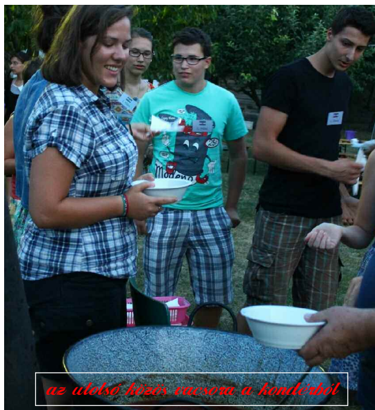
az utolsó közös vacsora a kávézóban!