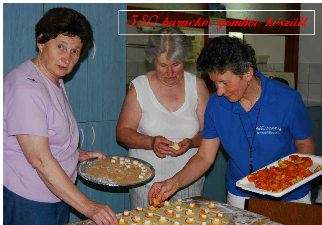
580 barackos-gombóc készült!