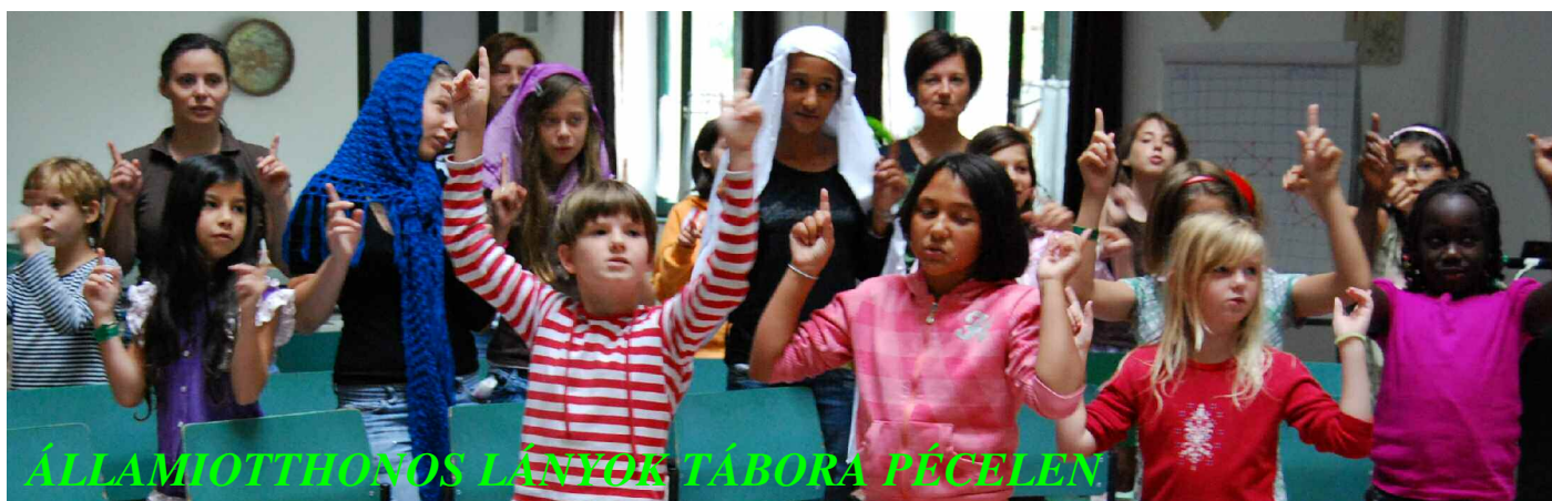
ÁLLAMIOTTHONOS LÁNYOK TÁBORA PÉCELEN