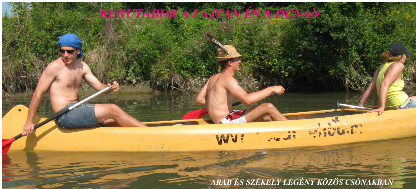
ARAB ÉS SZÉKELY LEGÉNY KÖZÖS CSÓNAKBAN

Kenutáborunk igazi kuriózum volt: Bruck, Zundorf, Bécs, Hainburg, Pozsony és Mosonmagyaróvár gyönyörű városai mellett hajózva, 3 ország vizein szeltük a habokat: a Lajtán és a Dunán. Bejártuk a Szigetköz vadregényes csatornáit, Zundorfban a szabad ég alatt sátorozva csodálkoztunk rá a ragyogó csillagos égre, hatalmas szélkerekek mellett lapátoltunk vadkacsákkal versenyezve, és közben nem tudott szemünk betelni a gyönyörűen virágzó bokrok, zöldellő partok, ámulatba ejtő folyórészek láttán. Már egészen profi módon emeltük át kenuinkat az akadályokon, kerültük meg a vízduzzasztókat és malmokat. Dévény váránál örvényekkel néztünk farkasszemet, majd a magas falakra felmászva csodáltuk az egymásba torkolló Morvát és Dunát. A hatalmas sziklaszirtekről leereszkedve fáradtan kapaszkodtunk össze, és csorogtunk tovább a Dunán. Vontató- és szárnyashajókat kerülgetve, dacoltunk esővel, széllel, arcunkba csapódó hullámmokkal, lapátoltunk gyönyörű napsütésben. Az idei év a borulások, vízbe pottyanások nagy éve is volt, a merészebbek nagyokat úsztak, fejest ugráltak és egymást dobálták a 15 fokos vízbe. A közös programok vidám beszélgetések, nagy hallgatások és egymás ugratása jegyében teltek, de szóba kerültek komoly témák is az esti áhítatok kapcsán. Túránk végén fáradtan, de élményekkel és tapasztalatokkal gazdagabban eveztünk újra hazai vizekre, túravezetőnkkel már a következő évi kenutábor útvonalát tervezgetve. ( Latinovits Ágota túrafelelős )