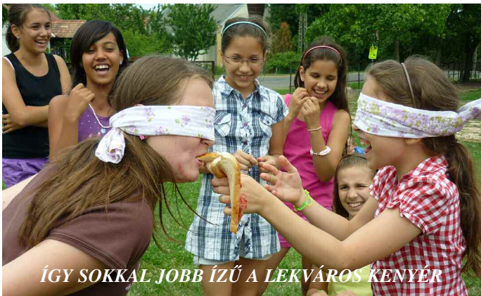
ÍGY SOKKAL JOBB ÍZŰ A LEKVÁROS KENYÉR