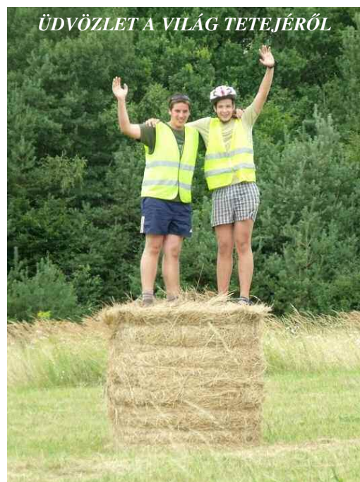
ÜDVÖZLET A VILÁG TETEJÉRŐL