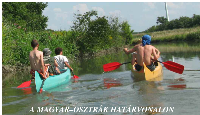
A MAGYAR-OSZTRÁK HATÁRVONALON