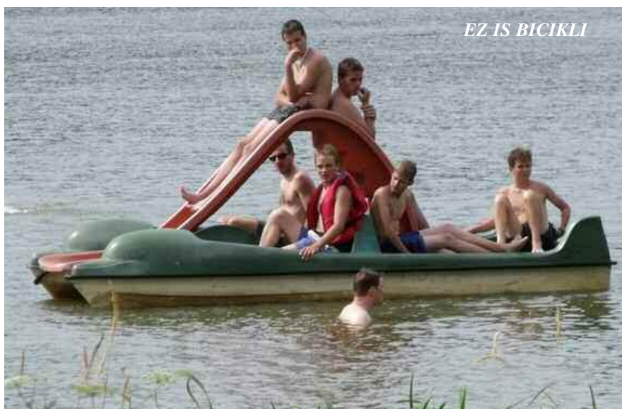
EZ IS BICIKLI