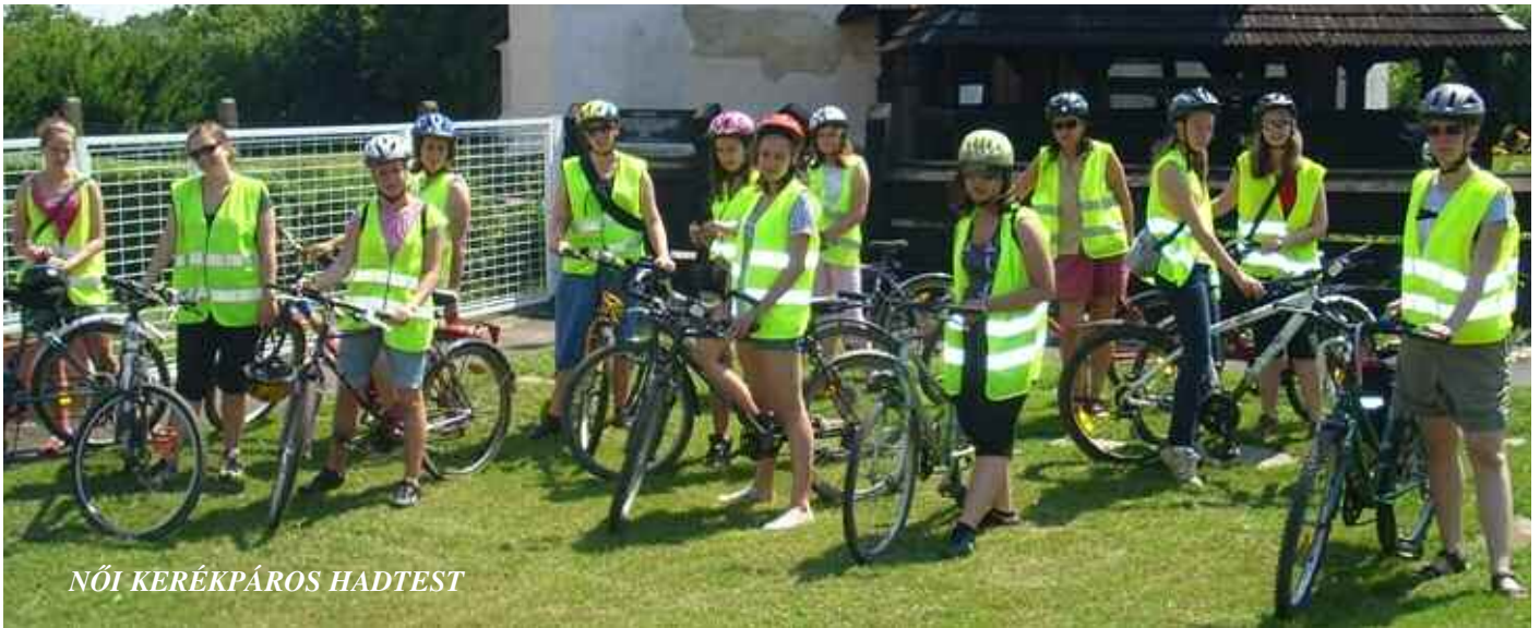
NŐI KERÉKPÁROS HADTEST