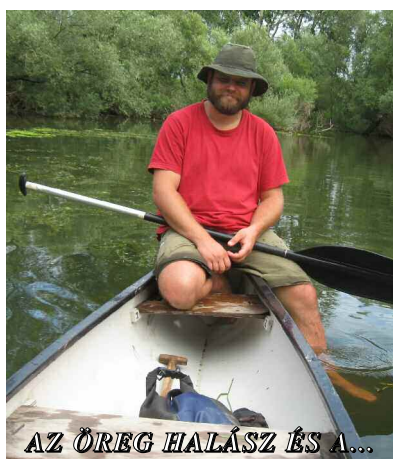
AZ ÖREG HALÁSZ ÉS A...