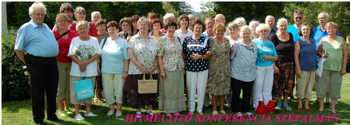
HÍTMÉLYTŐ KONFERENCIA SZÉPALMÁN