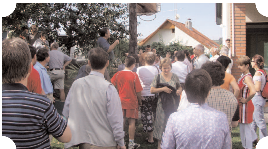
Képek a családi napról