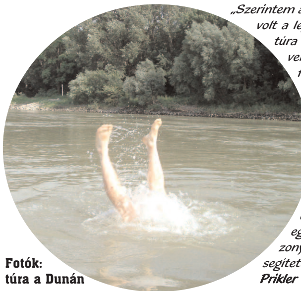
Fotók: túra a Dunán

„Szerintem az eddigi négy vízi túrából ez volt a legjobb. Az első kettő csillagtúra volt, de a lelkész nem jött velünk, és talán ezért nem forrt össze annyira a csapat. Az egy évvel korábbi borzasztóan nehéz volt a nagy távok miatt. A tavalyit – szerintem – sikerült jól behatárolnunk. Mindig jutott idő az imádságra, beszélgetésre...”