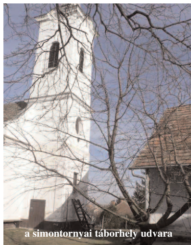
a simontornyai táborhely udvara