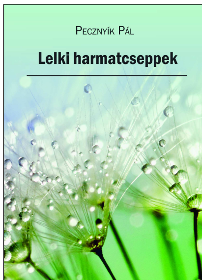
Pecznýk Pál Lelki harmatcseppek Ára: 400,- Ft