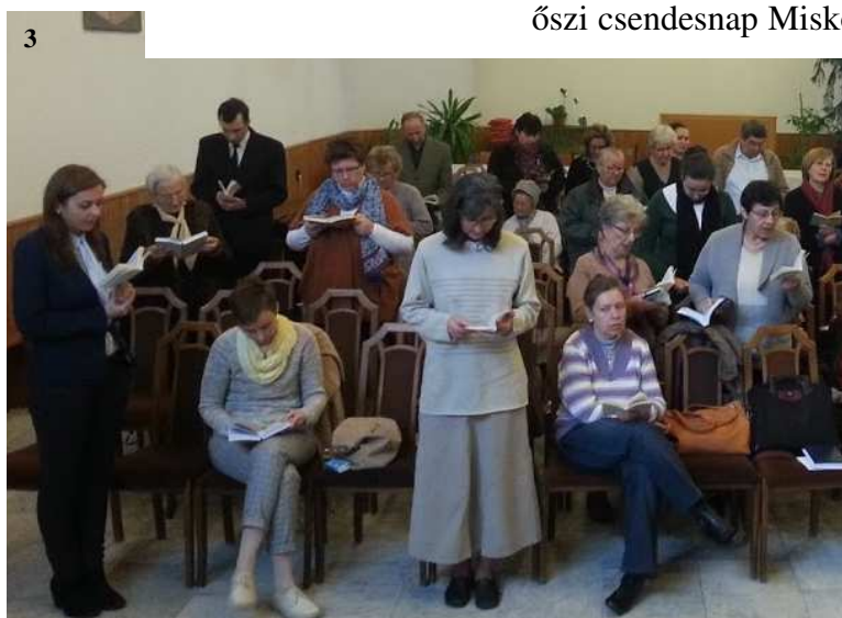
BSz csendeshét Mátraházán (1), ifjúsági szolgálók képzése Gyulán (2), ősz csendesnap Miskolcon (3-4)