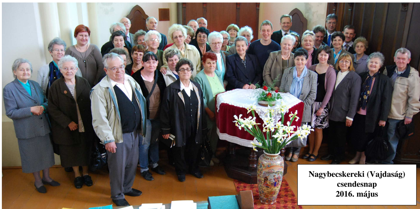
Nagybecskereki (Vajdaság) csendesnap 2016. május