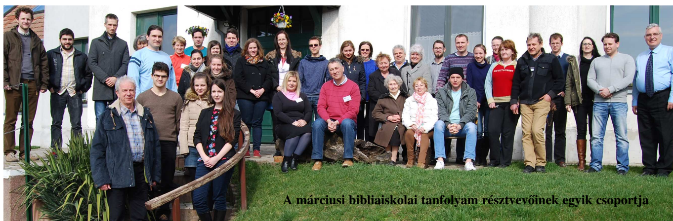
A márciusi bibliaiskolai tanfolyam résztvevőinek egyik csoportja