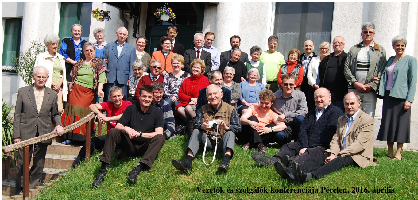
Vezetők és szolgálók konferenciája Pécelen, 2016. április