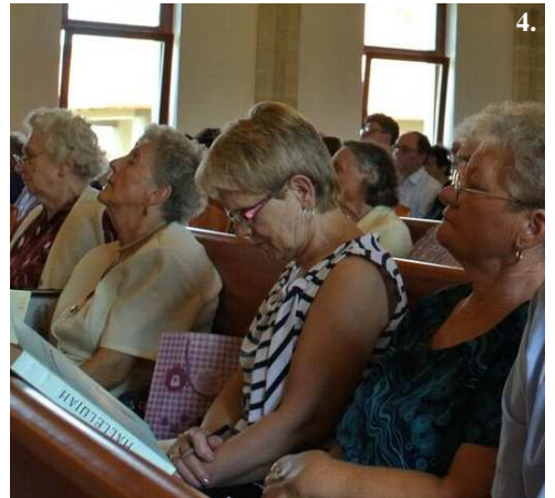
4-5. Nyékládháza – júniusi BSz körzeti csendesnap