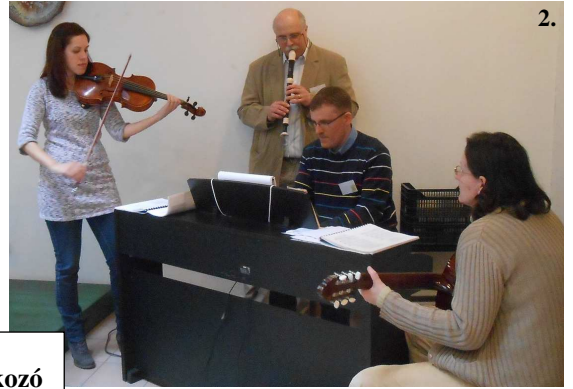
1-3. Tavaszai BSz 30+ találkozó Pécelen