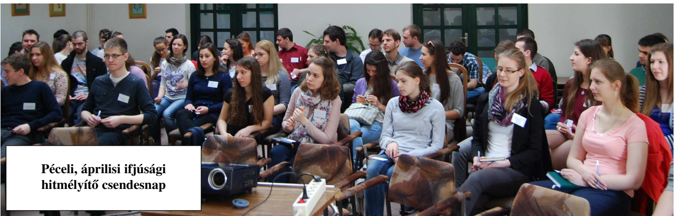
Péceli, áprilisi ifjúsági hitmélyítő csendesnap