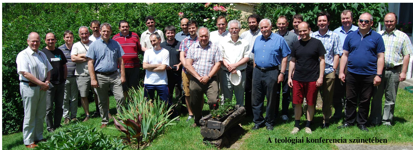
A teológiai konferencia szünetében

A Biblia és Gyülekezet című folyóiratra a 11742331-20003610 számlaszámon vagy postai utalványon lehet előfizetni Előfizetési díj 2016-ban: belföldre: 2.500,- Ft/év; (10 pld. felett 2.200,- Ft/pld.); külföldre: – európai országokba 4.800,- Ft/év; – egyéb országokba 5.900,- Ft/év. Az előfizetés nélküli árus példány ára 350,- Ft. A folyóirat megjelenik negyedévenként.