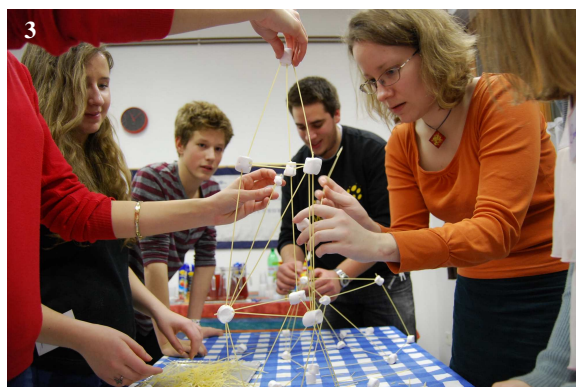
BSZ ifjúsági szilveszter – 2013. (1-3. kép)