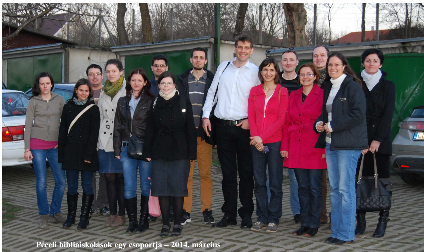
Péceli bibliaiskolások egy csoportja – 2014. március