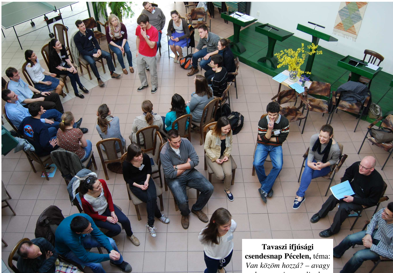
Tavaszi ifjúsági csendesnap Pécelen, téma: Van közöm hozzá? – avagy hogyan viszonyuljunk a politikához?