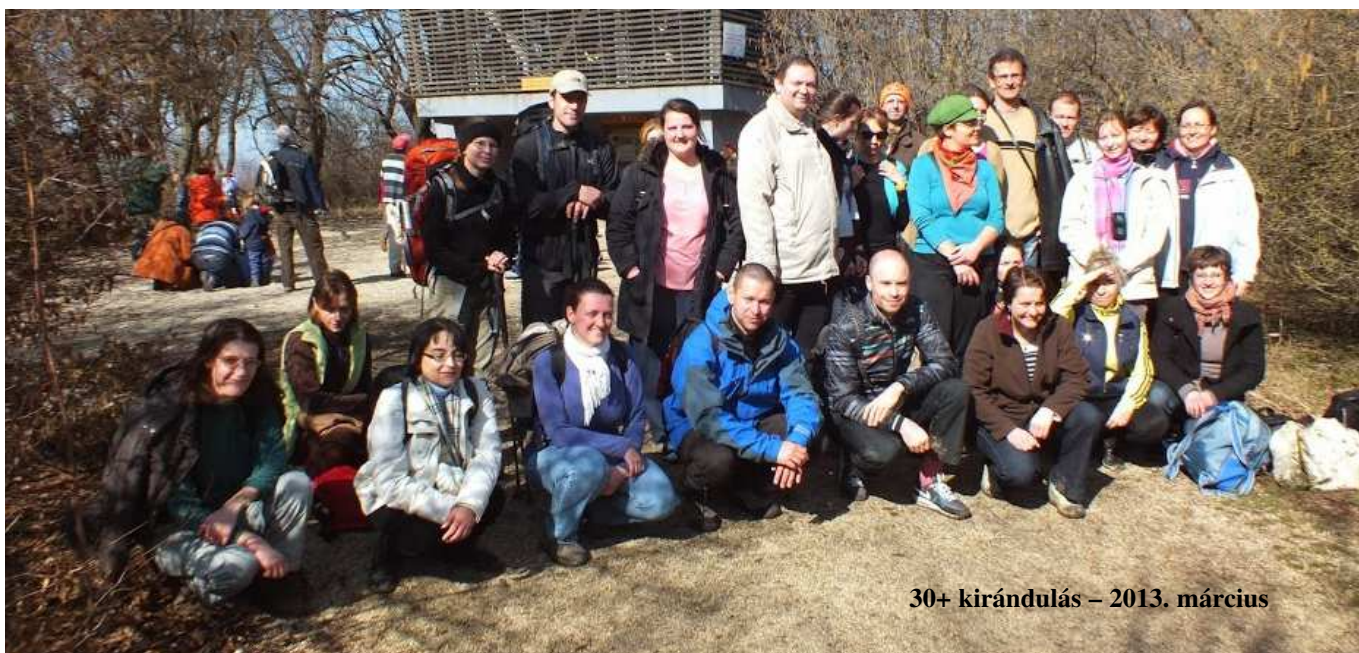
30+ kirándulás – 2013. március