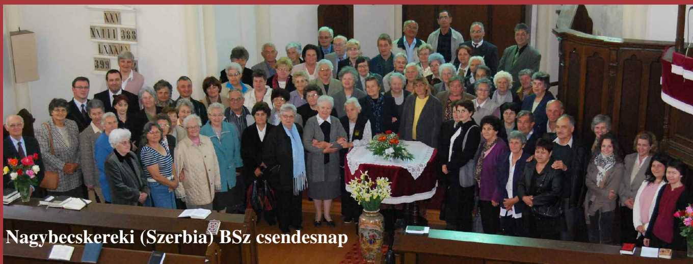
Nagybecskereki (Szerbia) BSz csendesnap