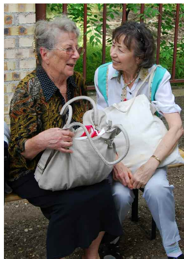
Közgyűlés és tavaszi csendesnap Budapesten, 2013. május 1.