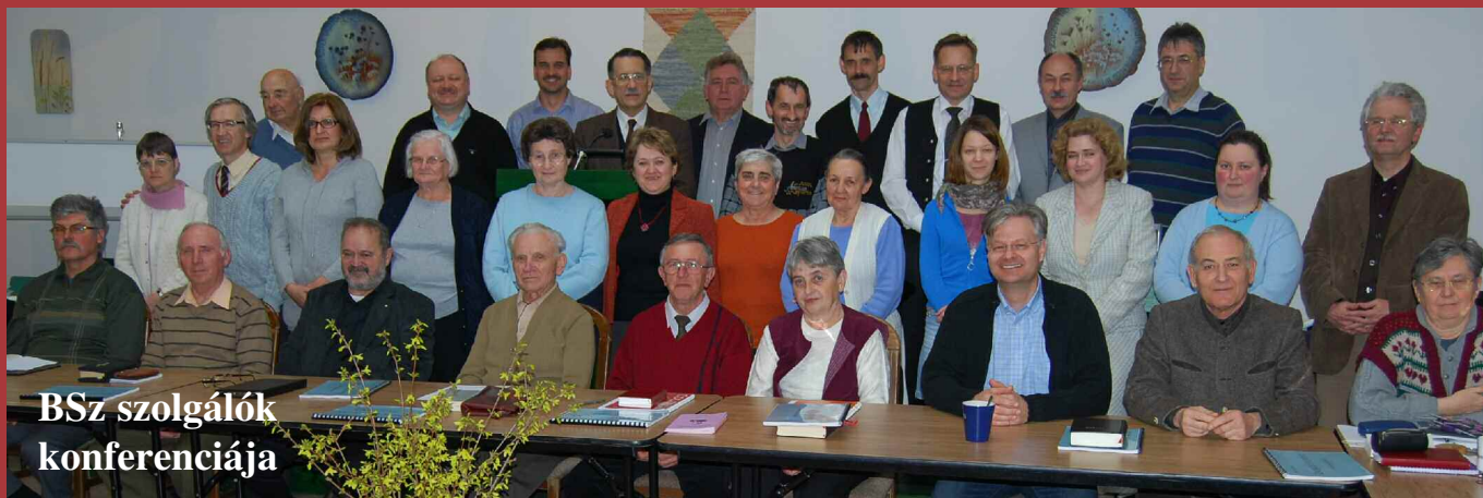
BSz szolgálók konferenciája