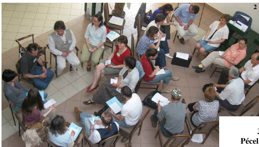
BSZ szolgálok és vezetők konferenciája, Pécel, 2012. április