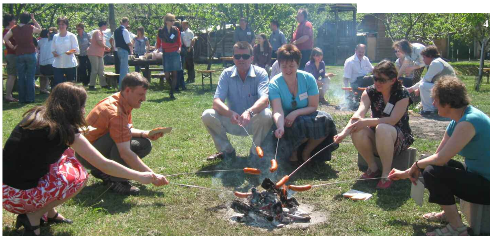
30+ találkozó Pécel, 2012. április (2-5)