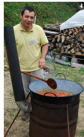
Családósnap Pécel, 2012. június (3-7)