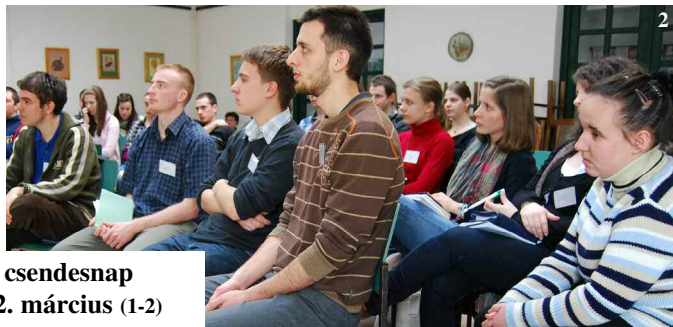
Ifjúsági csendesnap Pécel, 2012. március (1-2)