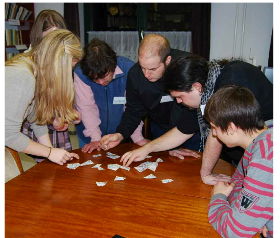
Ifjúsági szilveszter Pécel, 2011.