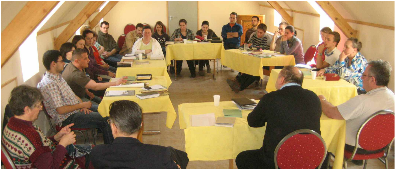
A Biblia Szövetség programjain szolgáló fiatal önkéntesek tavaszi képzését márc. 15-18. között a vajdasági Bácsfeketehegyén tartottuk, amin részt vettek a BSZ vezetői is