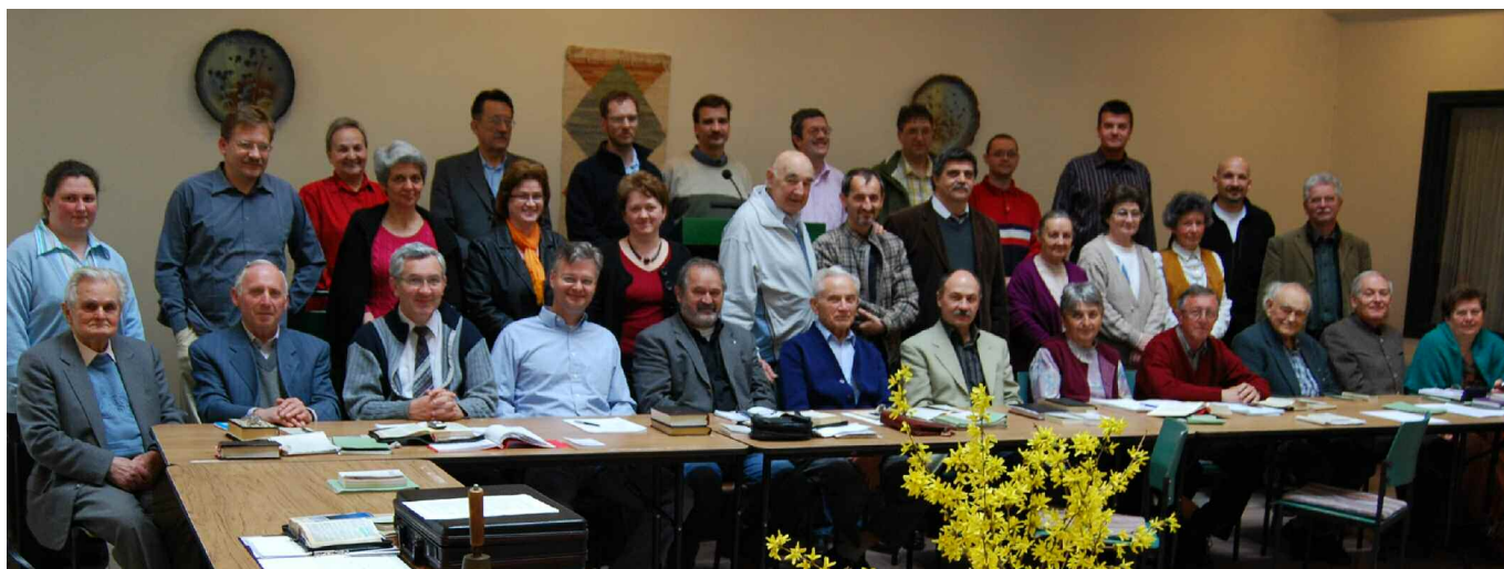
Csoportkép a Biblia szövetségi szolgálók és vezetők konferenciájáról, ahol a BSZ munkáját és jövőjét érintő kérdésekről tanácskoztak a résztvevők. A szövetségi munka lelki háttérét szolgáló előadások, beszélgetések segítették a felkészülést.