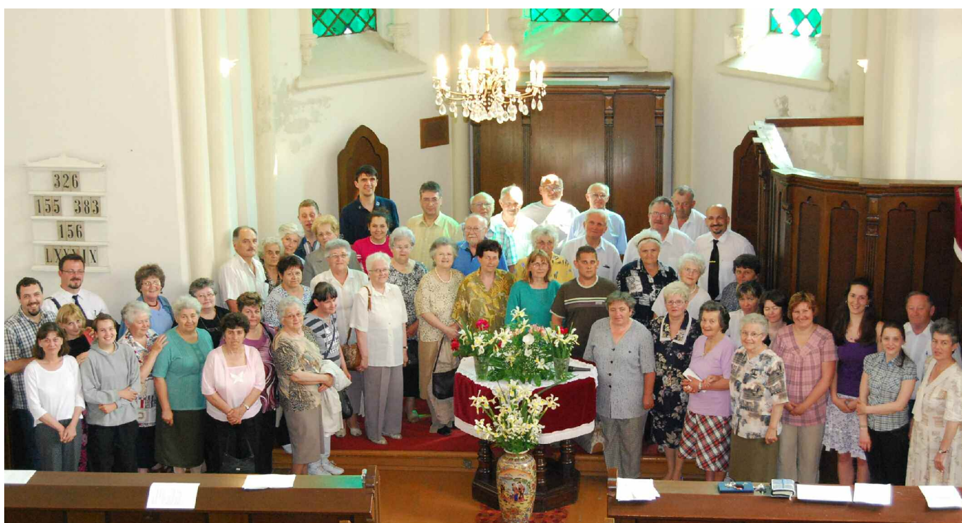
A nagybecskereki (Vajdaság, Délvidék) református gyülekezet templomába szervezett csendes nap résztvevőinek egy csoportja. A konferencián a Biblia Szövetség képviselői szolgáltak.

A Biblia és Gyülekezet című folyóiratra a 11742331-20003610 számlaszámon vagy postai utalványon lehet előfizetni Az előfizetési díj 2011-ben nem változik, azaz: belföldre: 2.200,- Ft/év; (2.000,- Ft/pld. 10 pld. felett); külföldre: - európai országokba: 4.500,- Ft/év; - egyéb országokba: 5.600,- Ft/év. Az előfizetés nélküli árus példány ára 350,- Ft. A folyóirat megjelenik negyedévenként.