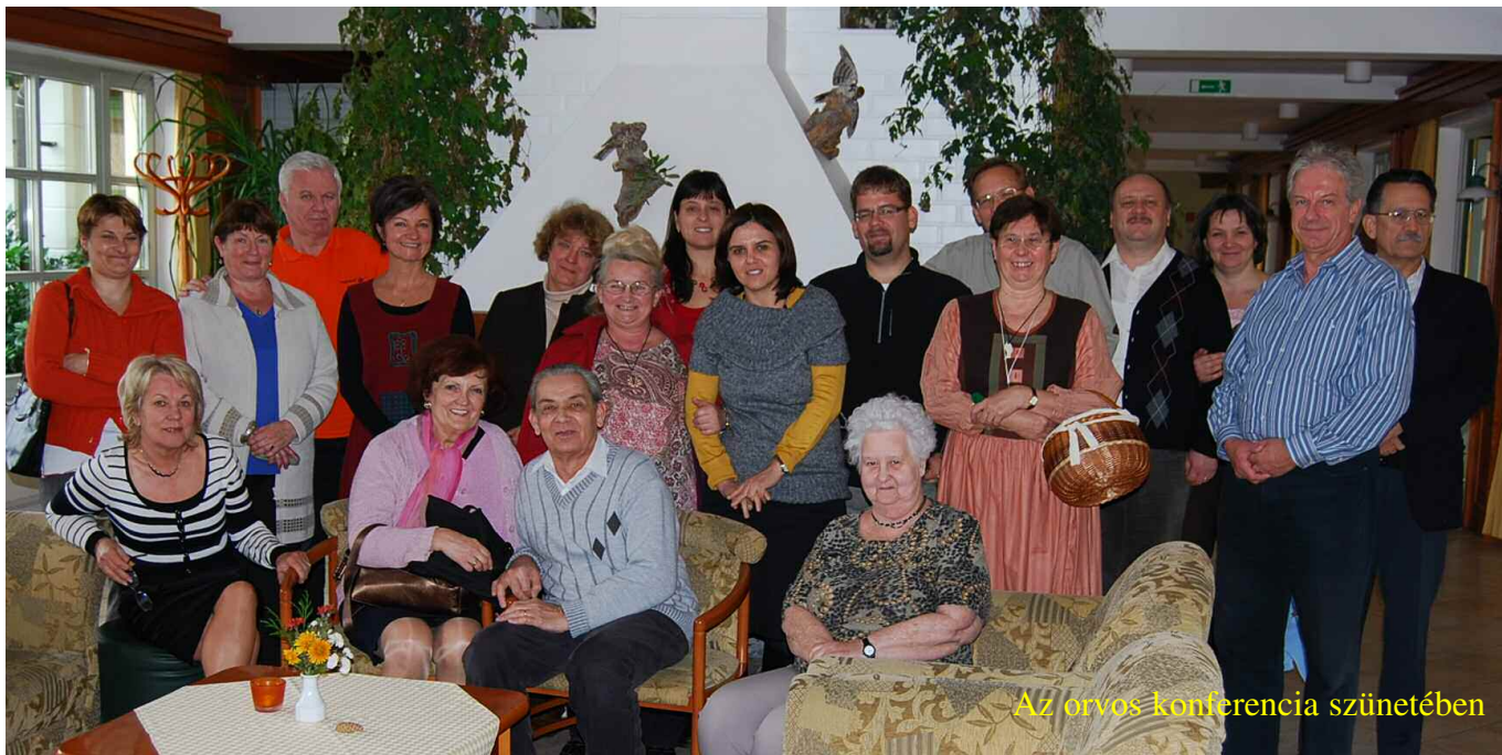
Az orvos konferencia szünetében