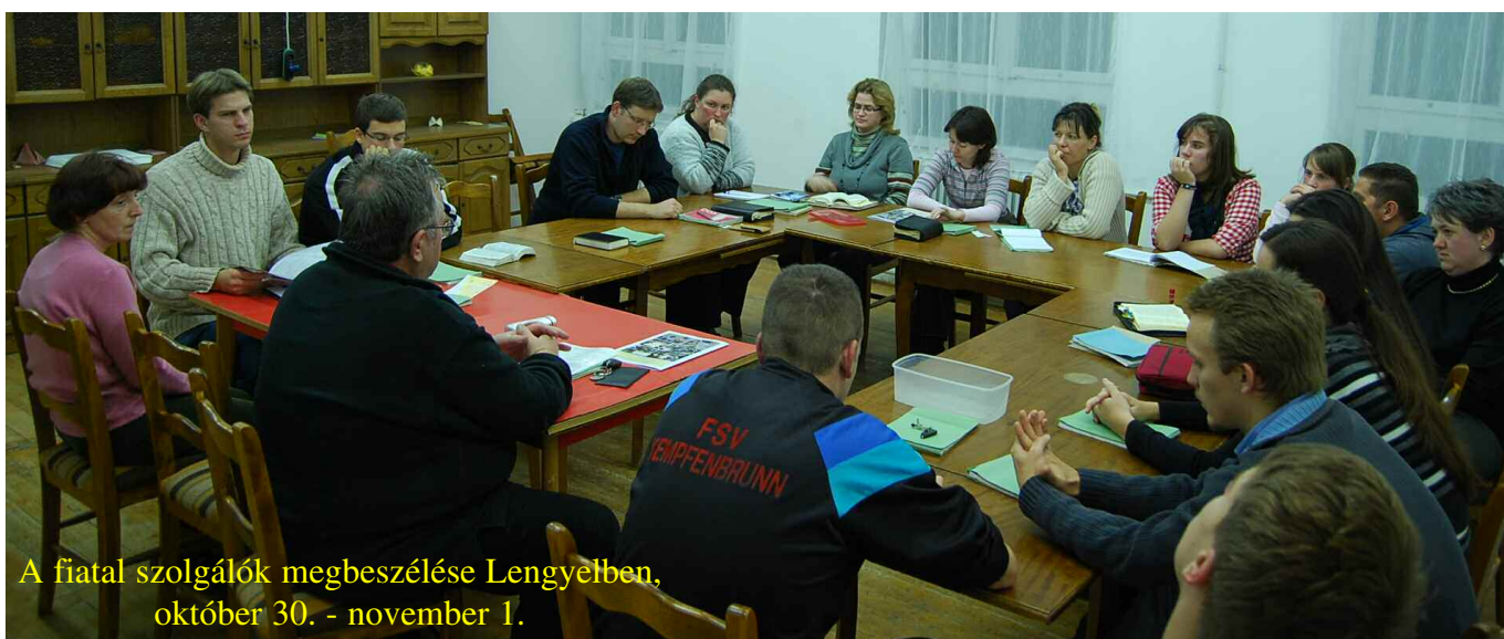
A fiatal szolgálók megbeszélése Lengyelben, október 30. - november 1.