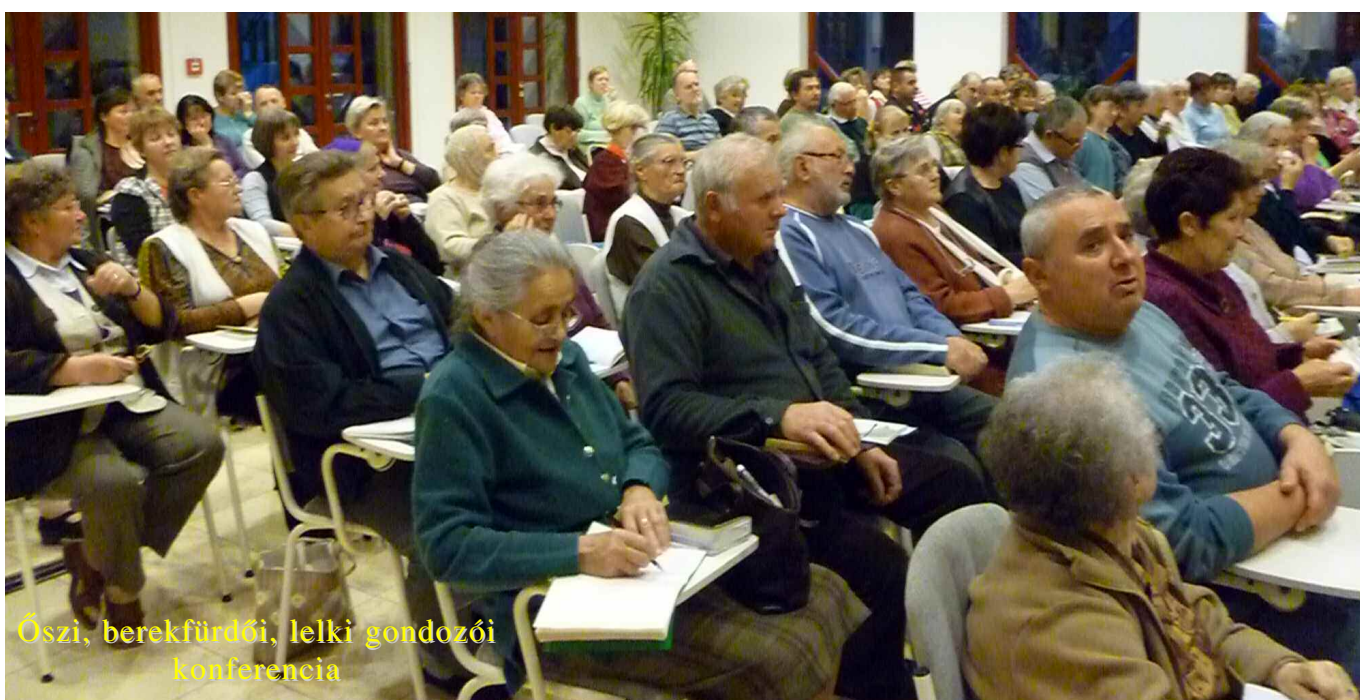
Őszi, berekfürdői, lelki gondozói konferencia