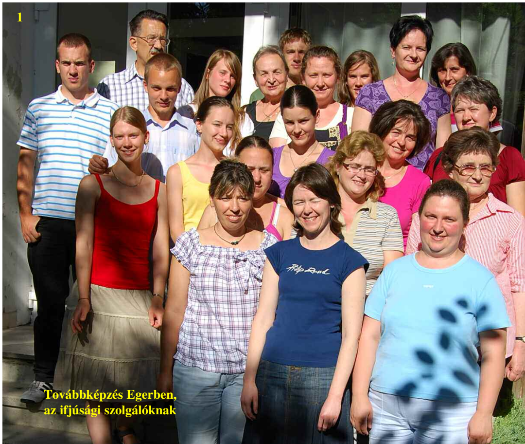
Továbbképzés Egerben, az ifjúsági szolgálóknak