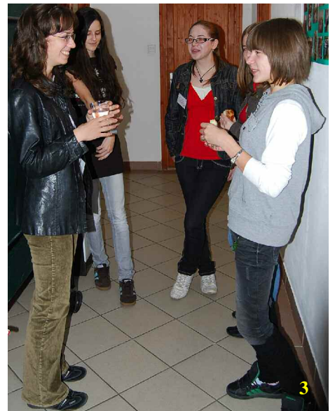
Őszi, ifjúsági csendes nap péceli székházunkban (2-3-4-5)