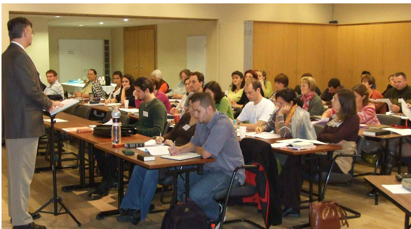
Szeptemberben megkezdődött a 2010/11-es tanév a budapesti bibliaiskolában is.