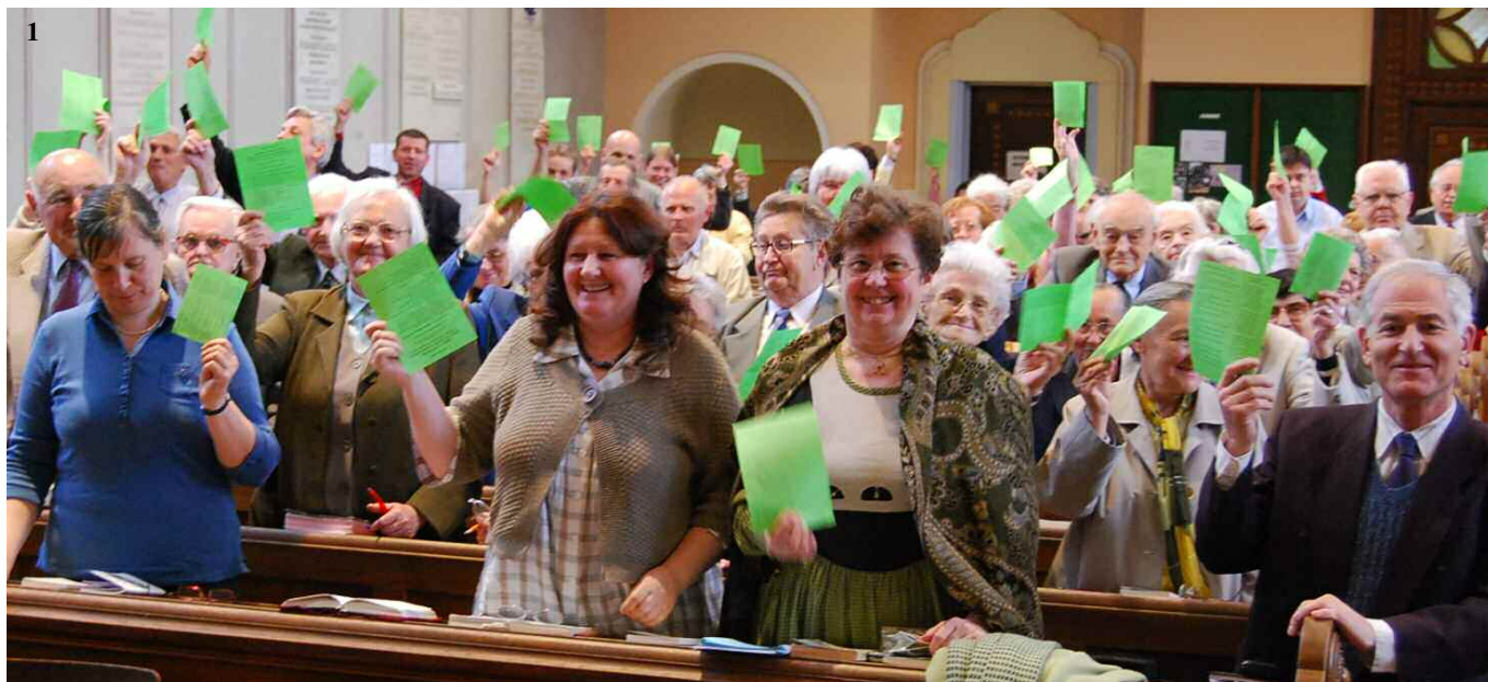
1 Szavaz a közgyűlés (1), erdélyi CE-s testvérek főtitkárunkkal (2), zongorajáték (3), bizonyágtevők (4-5-6)