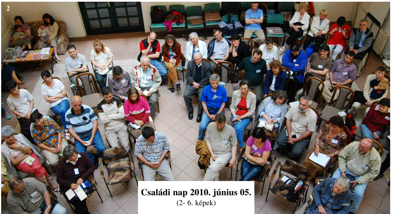
Családi nap 2010. június 05. (2- 6. képek)