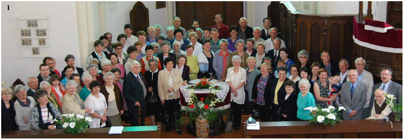
A nagybecskereki református gyülekezet vendégeként május utolsó hétvégéjén hatodik alkalommal tartott a Biblia Szövetség konferenciát (1. kép)