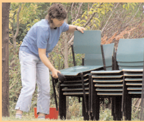
Családi nap, Pécel, 2008. június 7.