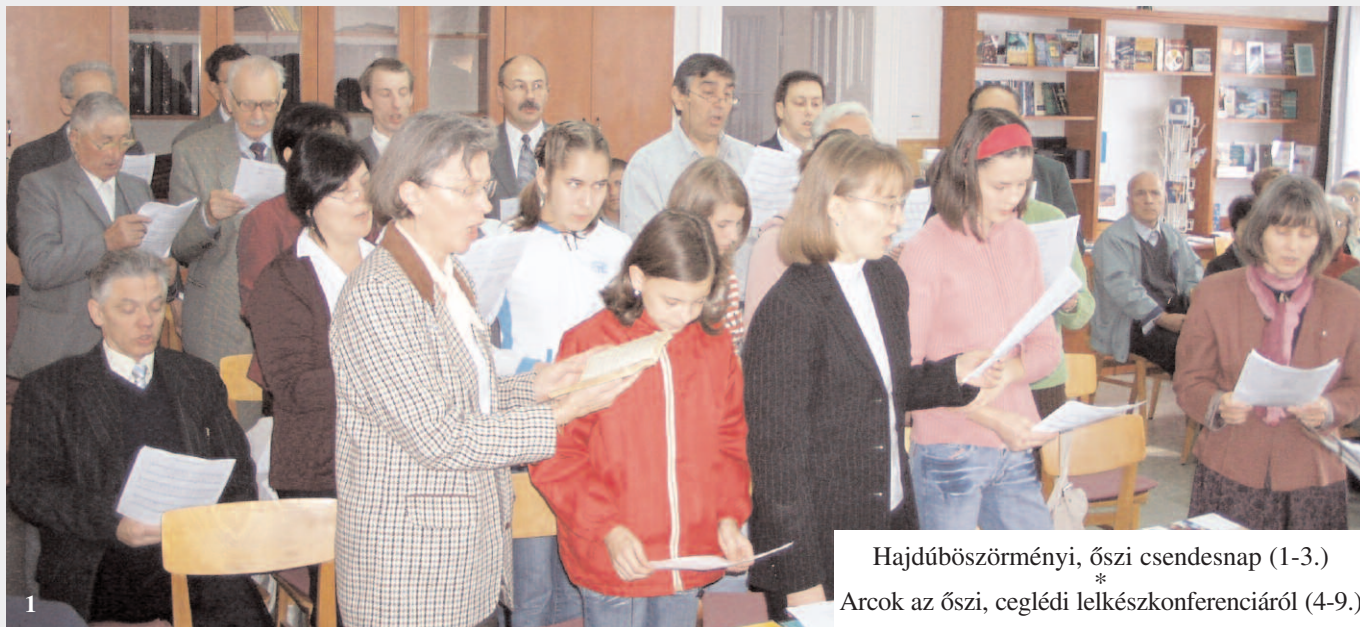
Hajdúböszörményi, őszi csendesnap (1-3.) * Arcok az őszi, ceglédi lelkészkonferenciáról (4-9.)