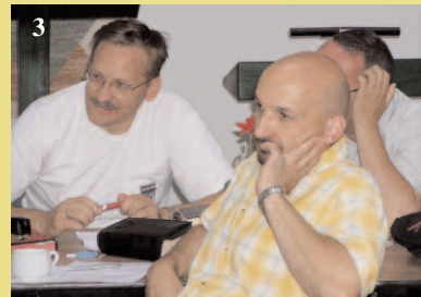
Teológiai konferencia péceli székházunkban 2007. június 25-29. (1-12.)