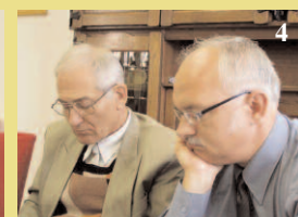
Az új összetételű BSZ Tanács első ülése (2007. 09. 15.) (1-7.)