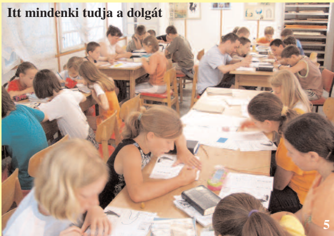
Itt mindenki tudja a dolgát