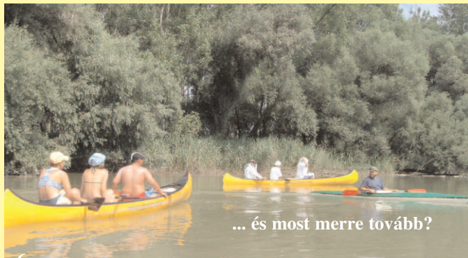
... és most merre tovább?