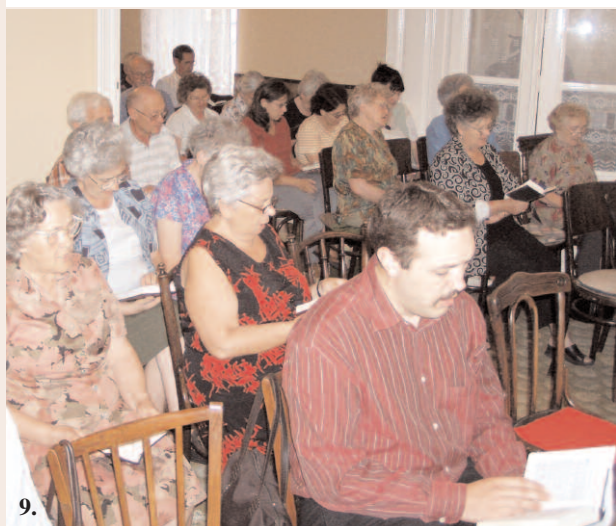
Augusztus végén a vajdasági Nagybecskerekén szolgáltunk: szombati csendesnap (7-8), bibliaóra (9), kirándulás Újvidéken, a NATO által lerombolt, és azóta újjáépített Duna hídon (10)