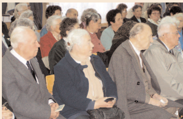
Hajdú- böszörményi csendesnap 2005. 10. 01. (1-7) * Egri körzeti alkalom 2005. 09. 12. (8-9)