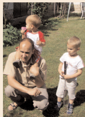
BSz családi nap - 2005. szeptember 3.