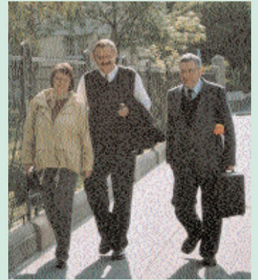
BSz közgyűlés 2005. április 30.