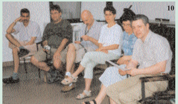
Június 4-én, tavaszi családi napunkon készült felvételek (7-14)