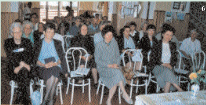
BSz fiatalokat fogadott a Szatmár-beregi BSz kör. A négy napos program emlékeiből idézünk a képekkel és az írásos beszámolóval (lásd: Hírek – közlemények). (7-15)