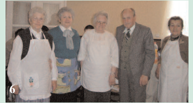
A hangulatos vajdasági kirándulás pillanatai a vendéglátókkal (Nagybecskerek). A maratoni gyalogtúra a bombatalálattól megsérült TV-torony mellett vezetett. (1-6)