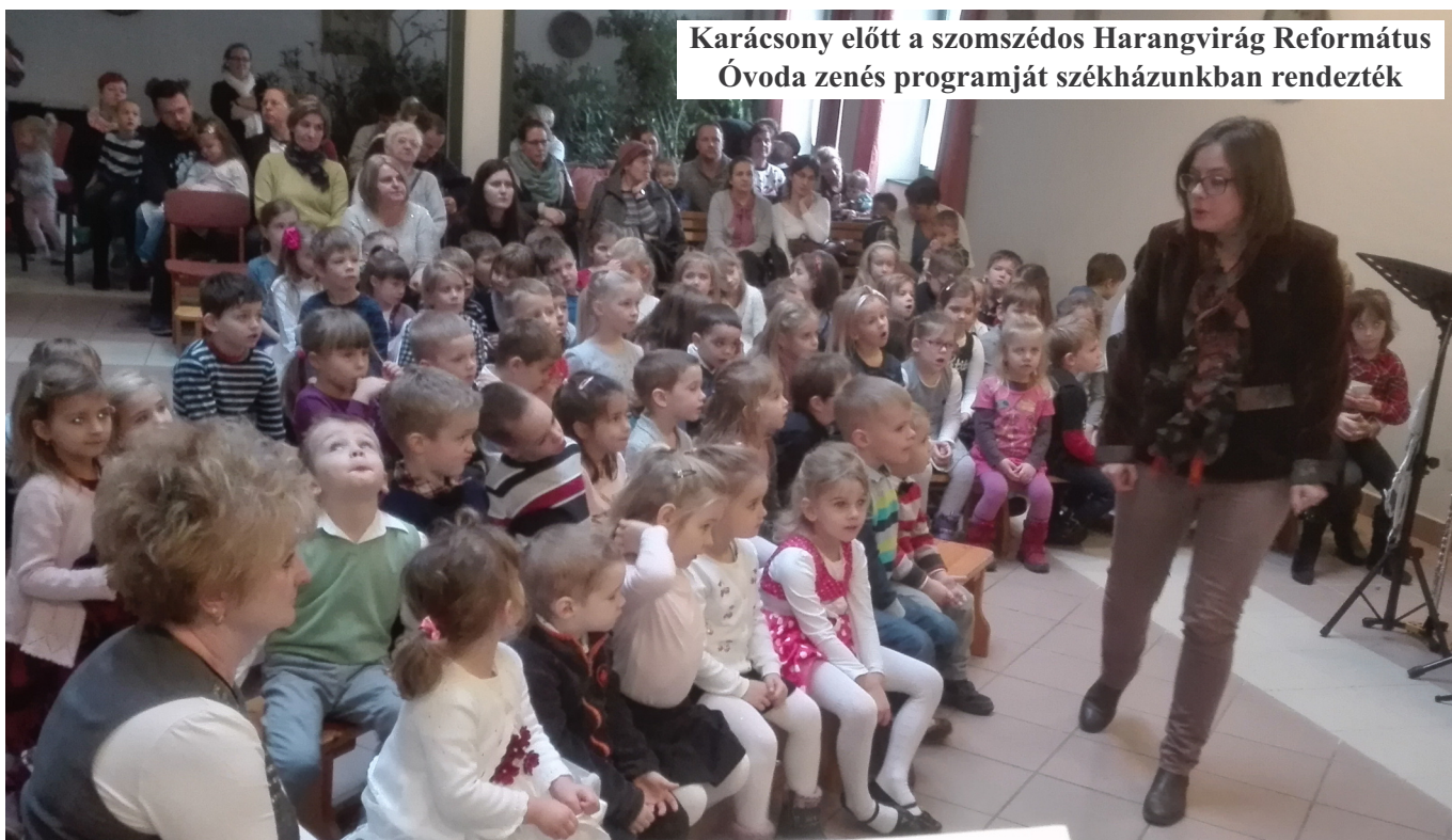
Karácsony előtt a szomszédos Harangvirág Református Óvoda zenés programját székházunkban rendezték