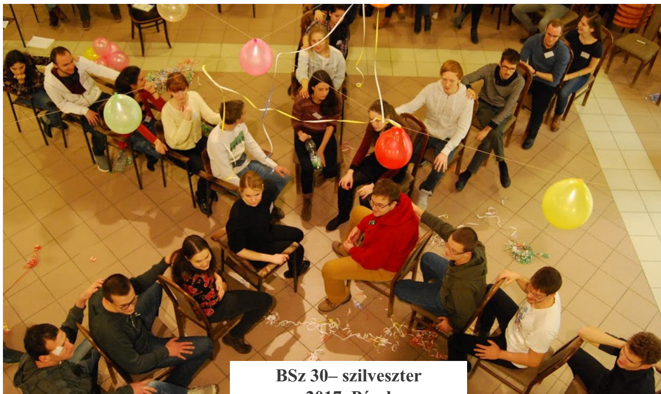
BSz 30– szilveszter 2017. Pécel